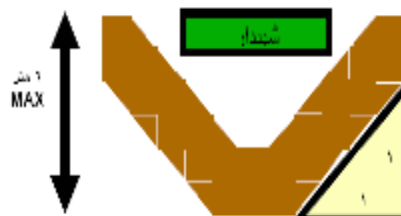
شکل 1. شیبدار سازی