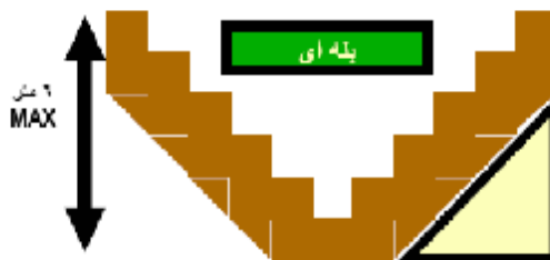
شکل 3. پله بندی

در این روش نوع خاک ، نسبت عرض به ارتفاع دیواره مورد پله بندی را تعیین می‌کند . (شکل 3)