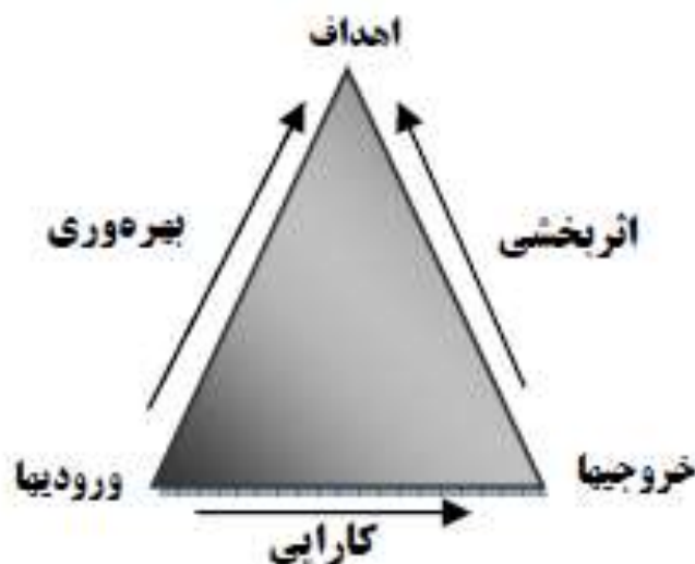
شکل ۱: ارتباط کارایی، اثربخشی و بهره‌وری

بهره‌وری مفهومی است که برای نشان دادن نسبت برون داد یک فرد، واحد و سازمان به کار گرفته می‌شود هر چه بهره‌وری یک سازمان بیشتر باشد هزینه تولید واحد کار در آن کمتر خواهد بود. در جهان پر رقابت امروز اگر بخواهیم بهره‌وری سازمان محل کار خود را افزایش دهیم باید با نیروی انسانی کمتر، سرمایه کمتر، زمان کمتر، فضای کمتر و به طور کلی با منابع کمتر، تولید بیشتری داشته باشیم. بهره‌وری یک سازمان بیش